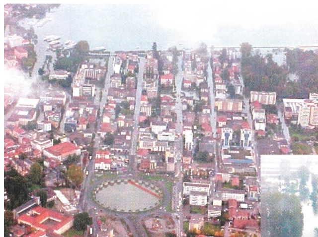
Per i mezzi d'intervento notevoli difficoltà causa strade allagate.

Die Società Elettrica Sopracenerina erlebte 1993 böse Überraschungen, als der Langensee über die Ufer trat und hohe Schäden an den öffentlichen elektrischen Anlagen hinterliess. Bereits sieben Jahre später kam das Hochwasser auf einen noch höheren Pegel. Diesmal konnten die Schäden in Grenzen gehalten werden, da man aus den Ereignissen von 1993 gelernt hatte und darauf vorbereitet war.