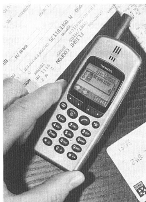
Abhörsicher telefonieren mit dem Handy

Um die Sprachsignale verschlüsselt übertragen zu können, simuliert das Topsec-GSM eine Datenübertragung. Es