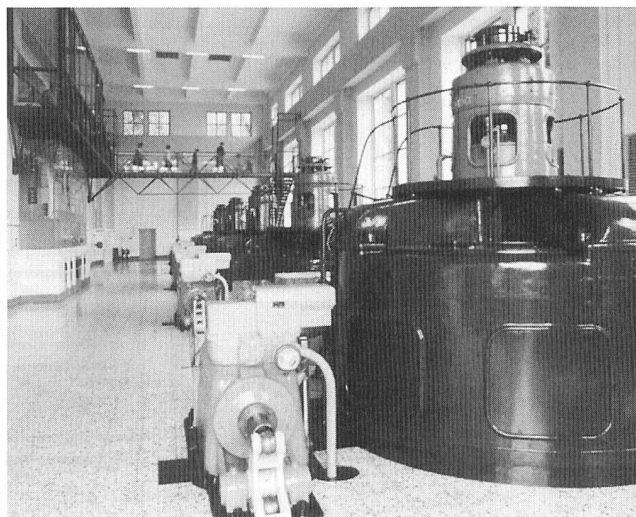
Informationszentrum im aktiven Kraftwerk.

(mb/p) Vom 23. bis 27. Januar 2001 findet in Basel die Schweizer Baumesse Swissbau 01 statt. Bereits sind über 50 000 m 2 Nettoausstellungsfläche belegt. Für die Elektrizitätswirtschaft dürfte vor allem die Sonderschau Energy-net interessant sein. Energy-net präsentiert die Themen nachhaltige Energieversorgung, rationelle Energienutzung sowie Trends und neueste Entwicklungen in den Bereichen Energie, erneuerbare Energien und Minergie.