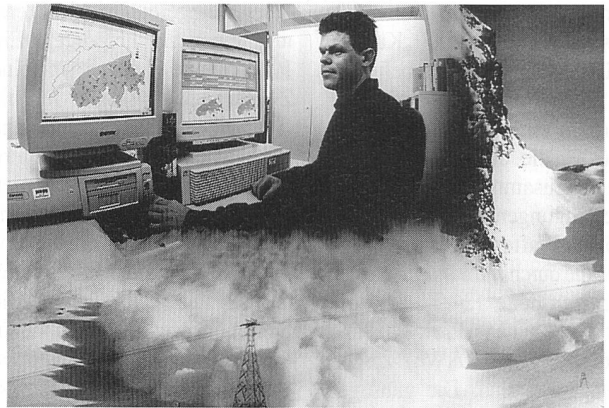
Ein neues Computermodell berechnet die Lawinengefahr in der Schweiz