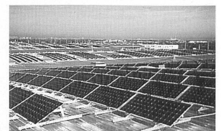
Solarstrom-Dachanlage auf der Münchner Messe.

bisher eine Leistungskennziffer von 84%. Dabei konnte die Emission von 1000 Tonnen Kohlendioxid vermieden werden. Auch in der Schweiz will man die grossen Dachflächen bei Messehallen energetisch nutzen. So hat die Messe Basel eine 237-kW p -Photovoltaikanlage bei Siemens Schweiz bestellt. Die Anlage beruht auf denselben bewährten Solarzellen und soll noch dieses Jahr in Betrieb genommen werden. Die Anlage auf dem Dach der Messe Basel wird durch die Firma Fabrisolar AG ausgeführt. Weltweit hat Siemens bis heute Solarzellen für mehr als 180 MW ausgeliefert.