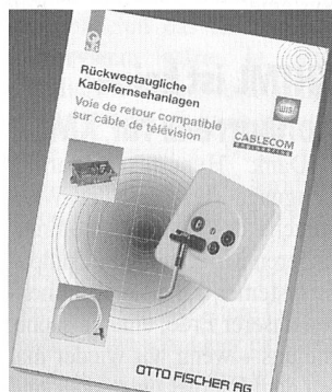
Neue Broschüre über digitale Kabelnetze

Das einwandfreie Funktionieren einer multimedial nutz-