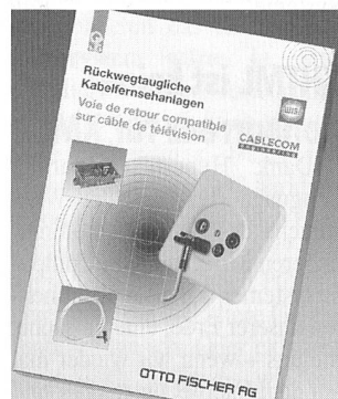
Neue Broschüre über digitale Kabelnetze

Das einwandfreie Funktionieren einer multimedial nutz-