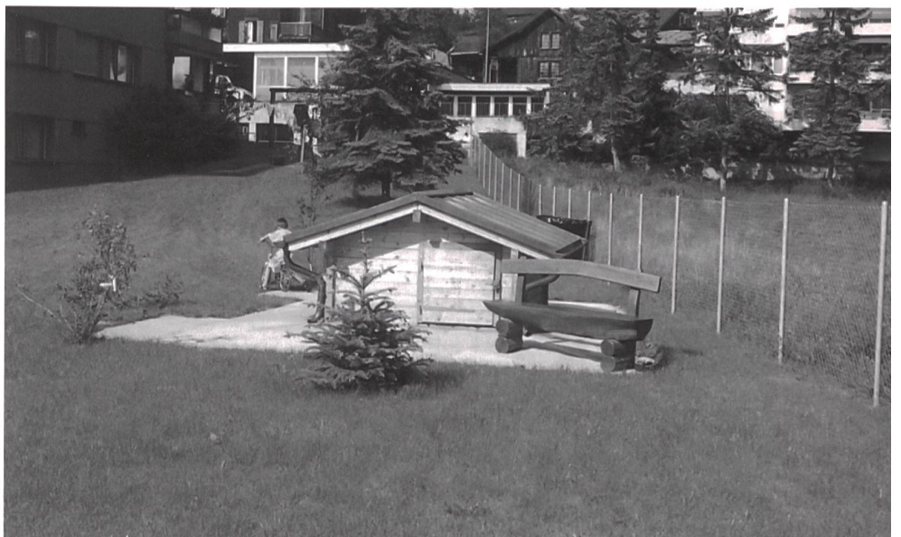
Bild 1 Heutiger Zustand des Bohrlochkopfes, als Chalet getarnt.

H. Füglistner AG Seestrasse 54 6353 Weggis