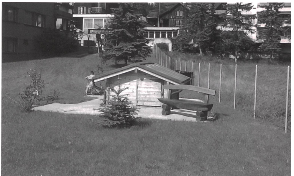
Bild 1 Heutiger Zustand des Bohrlochkopfes, als Châlet getarnt.

H. Füglistner AG Seestrasse 54 6353 Weggis