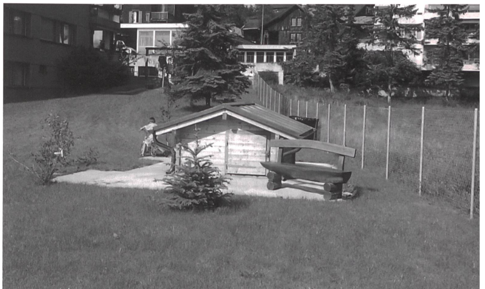
Bild 1 Heutiger Zustand des Bohrlochkopfes, als Chalet getarnt.

H. Füglistner AG Seestrasse 54 6353 Weggis