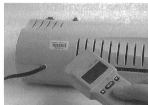
Strichcodescanner Inventory 2.0

Mit dem Inventarverwaltungsprogramm Inventory 2.0 von Securmark wird die Inventarverwaltung wesentlich vereinfacht. Die unbeliebte, aber notwendige Prozedur der Inventarerfassung kann auf einfache Weise rationalisiert werden. Sämtliche Daten der Gegenstände werden im Programm registriert. Mit einem