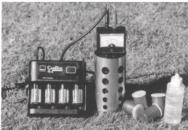
15-W-Brennstoffzelle mit integriertem Wasserstoffherzeuger zur Nachladung von Batterien

Die Tagungsreferate sind in einem Bericht zusammengefasst und können für 200 Fr. erworben werden bei: European Fuel Cell Forum, Postfach 99, 5452 Oberrohrdorf, oder über www.efcf.com .