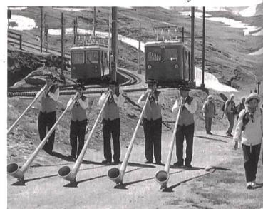
Après l'Assemblée à Zermatt, les membres de l'USIE sont montés à une altitude de plus de 2500 m, où ils ont été accueillis par des joueurs de cors des Alpes.