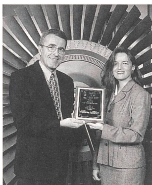
Mitarbeiter des Projekts Senoko mit der Preisplakette vor dem Gasturbinenrotor.