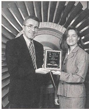
Mitarbeiter des Projekts Senoko mit der Preisplakette vor dem Gasturbinenrotor.