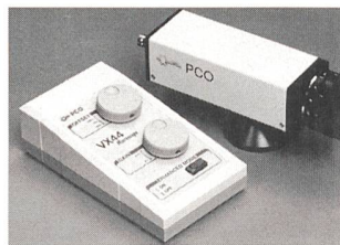
Schwarzweiss-CCD-Kamera VX 44

In der Mikroskopie sind Objekte oft nur mit wenig Kontrast auf hellem Hintergrund sichtbar. Durch Verschiebung des Offsets und anschließende Verstärkung des Videosignals ist mit dem VX-44-Microscope eine deutliche Kontrastverbesserung möglich. Auch schwie-