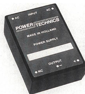
Stromversorgungen als AC/DC-Module

Die Single- bzw. Multioutput-Stromversorgung für Industrieapplikationen eignet sich für die Printmontage oder für die Montage auf Trägerelementen. Es handelt sich bei dieser Anschlussart um Schraubklemmen. Die Leistung der Kompaktmodule beträgt bis zu 25 W, wobei drei Ausgangsspannungen mit CE-konformer Stromversorgung erhältlich sind. Die vergossenen Leistungsteile sind auf lange Lebensdauer getrimmt, hohe Zuverlässigkeit und Effizienz sollen zur Ko-