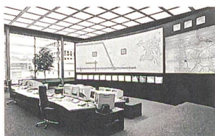
Bildschirmarbeitsplätze von Erich Keller AG

Erich Keller AG, 8583 Sulgen Tel. 071 644 88 88, Fax 071 644 88 80 http://www.erichkeller.com