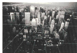
Orbit Network City, eine Stadt mit vielen Quartieren

An der diesjährigen Orbit heisst Alcatel Schweiz AG ihre Besucher in der attraktiven Network City willkommen. Diese Stadt umfasst Lösungen und Produkte von Alcatel. Gleichzeitig stellt sie ein konkretes Beispiel für eine unternehmensweite Kommunikationslösung dar. Die