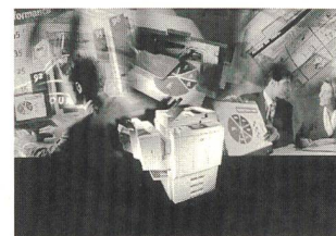
Das Duplex-Farbkopiersystem CF 900 von Minolta

Die Messerli Informationstechnik bietet dank vielfältiger Farb reproduktionstechniken eines der umfangreichsten Sortimente für A4- bis A0-Formate. Dabei spielt es keine Rolle, ob das ein Kopierer, Drucker oder Plotter ist. So zeichnet sich zum Beispiel das digitale, netzwerkfähige Vollfarbkopier- und -drucksystem CF 900 von Minolta durch eine subtile Kopienqualität. Das System erstellt 360 A4-Farbkopien/-drucke pro Stunde, und gedruckt wird im Format von A5 bis A3 randabfallend sowie auch Überformate bis 30,5 x 45,7 cm. Für professionelle DTP-Anwender bietet Messerli das System mit Color Controller (z. B. Fiery SI von Efi) an. Damit wird der CF 900 in Mac-, PC- oder Unix-Netzwerke inte-