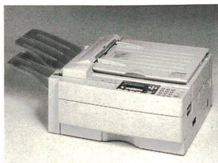
Fünf in einem: der Ricoh Aficio FX 00

Cellpack, langjähriger Schweizer Generalvertreter von Ricoh und laut Infosource Nummer eins im Schweizer Digitalmarkt, zeigt und demonstriert die neusten Office-Lösungen an der Orbit. Das Unternehmen hat nicht nur die Standfläche um 80% vergrößert, sondern mit einem doppelstöckigen Standbau auch ein optimales Kundenumfeld geschaffen. Gezeigt werden digitale und somit multifunktionale Kopier-, Fax- und Druckgeräte sowohl in Farbe als auch in Schwarzweiss. Fünf in einem bringt zum Beispiel der Ricoh Aficio FX 10