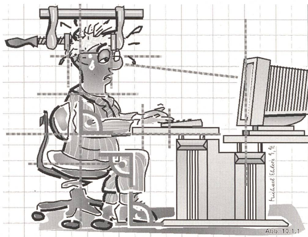
Die optimale Arbeitshaltung gibt es nicht. Um die Wirbelsäule zu entlasten, ist Bewegung das beste Mittel.

Arbeitstische, die einen Wechsel zwischen Sitzen und Stehen zulassen, bieten einen echten Qualitätssprung hinsichtlich einer dynamischen Arbeitsweise. Beim Wechsel zwischen Sitzen und Stehen passiert im Körper einfach mehr als nur beim Wechsel zwischen verschiedenen Sitzhaltungen. Neben einer sofort spürbaren Verbesserung des körperlichen Wohlbefindens bringt der freie Wechsel der Körperhaltung einen erstaunlichen Effekt: Auch die geistige Leistungsfähigkeit und der kreative Aktionsradius des arbeitenden Menschen erweitern sich beträchtlich. Weitere Informationen über Ergonomie im Büro im Internet unter http://www.joma.leuwico.com .