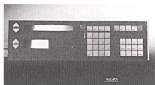
Dynapic-Membrane auf Kabelab-längmaschine

Das sind Vorteile, die sich in allen Bereichen des täglichen Lebens bezahlt machen. Das von Algra ebenfalls entwickelte Dynasim erweitert das Anwendungsspektrum beträchtlich. Das zukunftsweisende