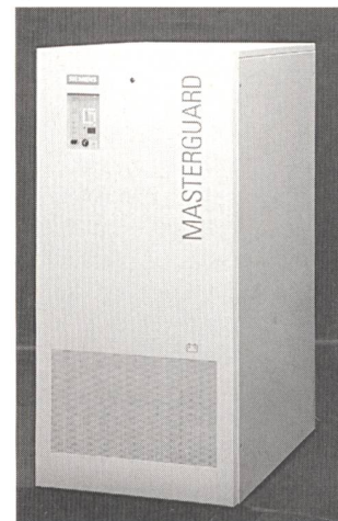
USV Masterguard für den Leistungsbereich von 10 bis 100 kVA

Siemens Schweiz AG, 8047 Zürich Tel. 01 495 58 71, Fax 01 495 55 02