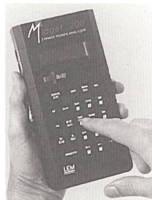
Der handliche Midget 200

einigt alle Funktionen in einem einzigen Gerät: dreiphasiges Multimeter, Energieverbrauchs- und Oberschwingungsanalysator sowie Datalogger und Störungsanalysator. Im Dataloggermodus speichert das Gerät die Effektivwerte von Spannung und Strom in jeder Phase, die Leistung, den Leistungsfaktor, die Energie, die Frequenz sowie Einschaltzyklen. Berechnete Werte für Energieverbrauch, Energiekosten pro Stunde, Monat und Jahr sowie Höchst-, Tiefst- und Mittelwerte für die Mehrheit der Messwerte werden jede Sekunde aktualisiert. Zeitpunkt und Höhe des maximalen Verbrauches werden