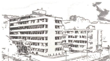
Elektron AG, gegründet 1951, 130 Mitarbeiter

Elektron zeigt Stehvermögen mit Ingenieur-Leistungen für umfassende Automatisierung. Beispielsweise für die Energiewirtschaft mit