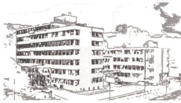
Elektron AG, gegründet 1951, 130 Mitarbeiter

Elektron zeigt Stehvermögen mit Ingenieurleistungen für umfassende Automatisierung.