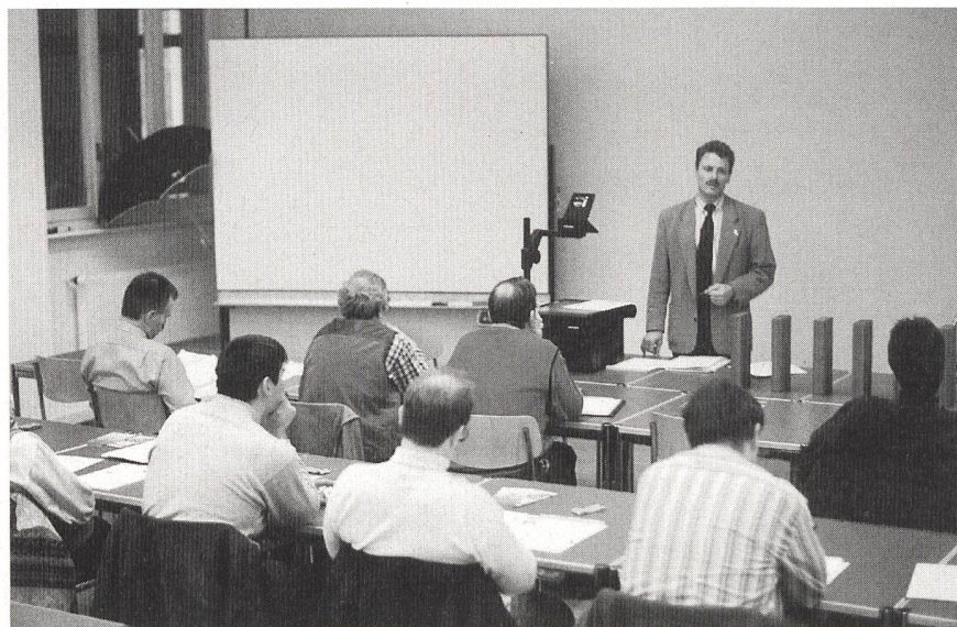
Bild 1 Schulung der Arbeitsgruppe Arbeitssicherheit der Centralschweizerischen Kraftwerke (CKW) zum Thema NBU.

Eine offene und sachliche Unfallverhütungs- und Informationspolitik zeigt dem Mitarbeiter auf, dass zwischen der Berufs-