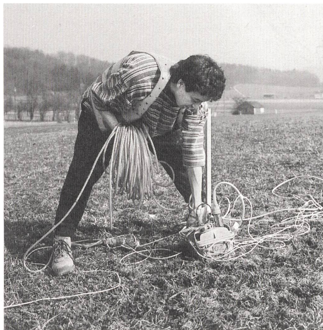
Seismische Messungen im Nord-Aargau.

Messungen auf dem Gebiet der Gemeinden Etzgen, Gansingen, Mettau, Oberhofen, Schwaderloch, Sulz und Wil vornehmen.