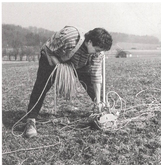
Seismische Messungen im Nord-Aargau.

Ähnliche Messungen werden auch im Zürcher Weinland zur Abklärung des Sedimentgesteins Opalinuston durchgeführt. Nach Vorliegen der seismischen Resultate aus dem Nord-Aargau sollen ein oder mehrere Bohrplätze in Absprache mit den Bundes-, Kantons- und Gemeindebehörden festgelegt werden. Die Nagra plant gegen Ende 1997 ein neues Sondiergesuch einzureichen, welches das 1994 eingereichte Gesuch Leuggern/Böttstein ablöst.