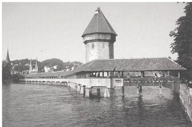
Die Infel-Tagung über markt- und kundenorientiertes Verhalten findet in Luzern statt.

Es besteht auch die Gelegenheit, drei weltbekannte Institute der EPF (Ecole polytechnique fédérale) Lausanne zu besuchen: das Institut für hydraulische Anlagen und Strömungslehre (IMHEF), die Versuchsanstalt für Wasserbau (LCH) und das Institut für Energiesysteme (LASEN).