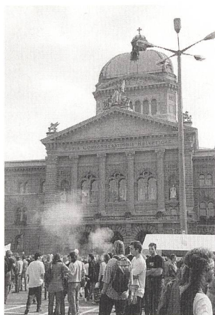
Viele wollen ins Bundeshaus, nur wenige kommen «draus».