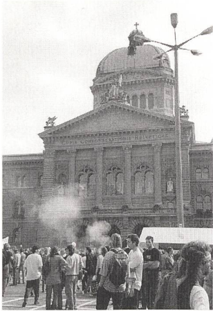
Viele wollen ins Bundeshaus, nur wenige kommen «draus».