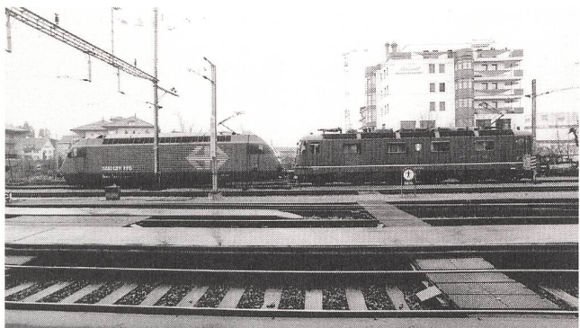
Lok 2000 mit der Re 6/6 im Simulationsversuch

Abwärtsfahren eines Zuges werden die Motoren einer Lokomotive elektrisch so gesteuert, dass sie nicht mehr antreiben, sondern mit sehr starken elektromagnetischen Kräften den Zug bremsen und gleichzeitig Strom an das Fahrleitungsnetz abgeben. Bis heute wurde ein rund 800 Tonnen schwerer Eisenbahnzug bei seiner Talfahrt am Gotthard zur Hälfte durch die elektrischen Motoren, zur anderen Hälfte durch die gusseisernen Bremsklötze an den einzelnen Wagen gebremst. Die ersten Resultate lassen darauf schliessen, dass die Motoren der Re 6/6 bei einer besseren Steuerung mit einer rund 20% höheren Bremsleistung und entsprechend höherer Energie-rückgewinnung sowie Verschleissreduktion bei der mechanischen Druckluftbremse gefahren werden können.