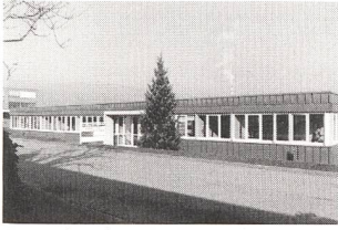
Hauptsitz der Invertomatic Systronic AG in Port

Systronic AG (IMS). Mit diesem Zusammenschluss entsteht ein Unternehmen, in dem alle Vertriebs- und Serviceaktivitäten für die komplementären Produkteprogramme der beiden Muttergesellschaften Invertomatic Victron Holding AG in Riazzino und der Industrie Automation Energiesysteme GmbH & Co in March-Buchheim (D) für den Schweizer und Liechtensteiner Markt vereint werden. Sitz der IMS ist Port, wo das Unternehmen ein eigenes Betriebsgebäude besitzt.