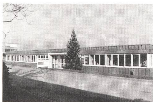
Hauptsitz der Invertomatic Systronic AG in Port

Systronic AG (IMS). Mit diesem Zusammenschluss entsteht ein Unternehmen, in dem alle Vertriebs- und Serviceaktivitäten für die komplementären Produkteprogramme der beiden Muttergesellschaften Invertomatic Victron Holding AG in Riazino und der Industrie Automation Energiesysteme GmbH & Co in March-Buchheim (D) für den Schweizer und Liechtensteiner Markt vereint werden. Sitz der IMS ist Port, wo das Unternehmen ein eigenes Betriebsgebäude besitzt.