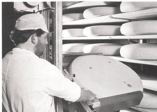
Käsepflege mit dem elektrisch betriebenen «Roboter». Damit werden die etwa zentnerschweren Emmentaler-Laibe aus den Gestellen gehoben und zurückgelegt.

Obwohl jedes Käserad nur alle paar Tage einmal drankommt, herrscht in der Halle reger Verkehr, und die Maschinen sind ausgelastet. Irgendeiner der vielen tausend Rundlinge ist immer unterwegs zur Wasch- und Wendemaschine. Als perfektes Wagenrad wird der Käse dann nach einem