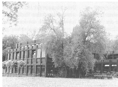
Das neue Microswiss- Zentrum in den Räumen der Ingenieurschule ITR in Rapperswil

breiteren Öffentlichkeit vor. Das im vergangenen Februar am Interkantonalen Technikum Rapperswil angesiedelte Mikroelektronik-Zentrum umfasst die Ingenieurschulen Winterthur, Zürich, St. Gallen, Buchs, Chur und Rapperswil. Bereits diesen Herbst beginnt am Microswiss-Zentrum Nord-Ost das erste, einjährige Nachdiplomstudium (NSD). In diesem Kurs soll mehr als die halbe Studiendauer einem praktischen Asic-Projekt (Application Specific IC) gewidmet werden.