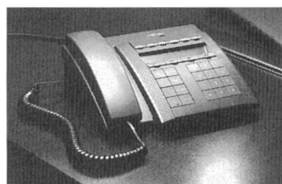
ISDN-Telefon Alcatel 2824

Kommunikationssysteme mit Vernetzungslösungen bilden den Schwerpunkt des Standes. Corporate Networks sind Gesamtlösungen, die verschiedene Aspekte umfassen. Da ist einmal die Gebäudeverkabelung, bei der besondere Flexibilität erforderlich ist. Ein weiteres Stichwort ist Internetworking. Darunter versteht man die Kunst, Netze zu entwerfen und zu implementieren, die Systeme aller Art, Grösse und Herkunft zusammenfassen können. Paketvermittelnde