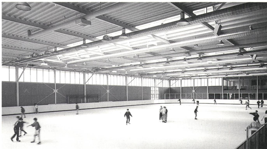
Bild 1 Für gutes Eis und trockene Luft in dieser Eiskunstlaufhalle sorgt eine Kälteanlage mit ungefähr 500 Kilowatt Leistungsaufnahme. Das Kühlmittel verdampft direkt in den kilometerlangen Stahlrohren, die im Beton unter der Eisfläche liegen

Bruno Dürr hatte sich natürlich versichert, nicht mit Platzpatronen zu schießen. Einige Stichproben per fachmännischem Augenschein hatten seine und Hubachers Mutmassung bestätigt, dass Kälteanlagen ähnliche Schwachstellen aufweisen wie Wärmepumpen – insbesondere zu knapp bemessene Wärmetauscher, falsch berechnete Kältemittelfüllung und ungenügend durchdachte Steuerungen. Um der Sache auf den Grund gehen zu können, stellten die beiden beim Nationalen Energie-Forschungs-Fonds (NEFF) der Energiewirtschaft 1985 ein Gesuch für Forschungsmittel. Auf den NEFF wirkten nicht nur die Verdachtsmomente überzeugend, wie Prof. Heini Gränicher als Vorsitzender des NEFF-Ausschusses sich erinnert, sondern auch das Energiesparpotential: In der Schweiz (wie in anderen Industrieländern auch) gehen rund 10% des gesamten Stromverbrauchs in Kälteanlagen, genauer in die Elektromotoren der Kältemittel-Kom-