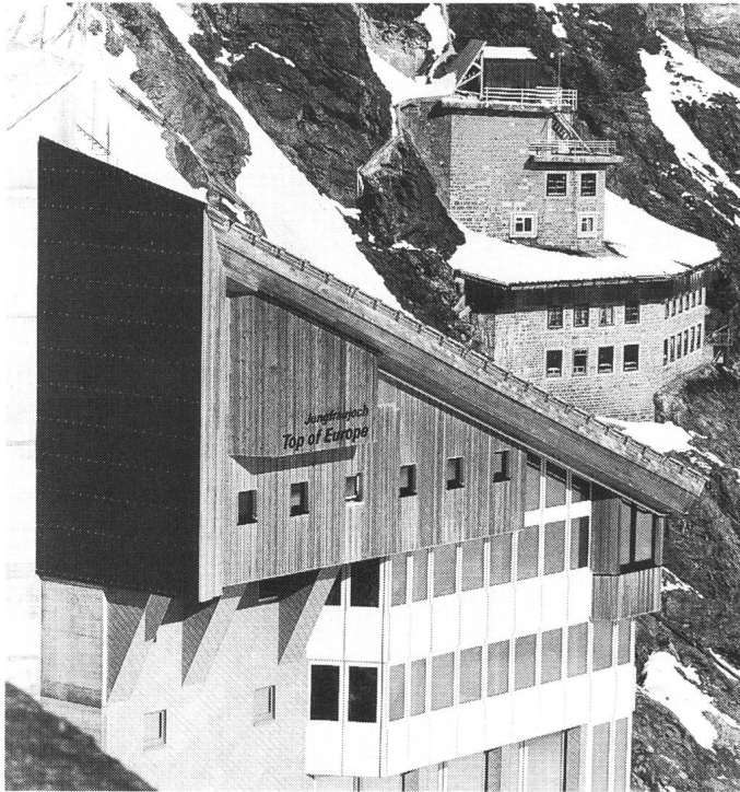
Bild 4 Berghaus und Forschungsstation Jungfraujoch Südwestansicht vom «Hotelfelsen», im Hintergrund das Gebäude der Forschungsstation

hülle besonders wichtig, und die hohe Windgeschwindigkeit sowie der Flugschnee verlangen eine hohe Luftdichtigkeit.