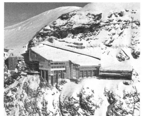
Bild 3 Berghaus Jungfrauojoch Am rechten Flügel ist das integrierte alte Gletscherrestaurant sichtbar

Wegen der tiefen Aussentemperaturen ist auf dem Jungfrauojoch eine gute Wärmedämmung der Gebäude-