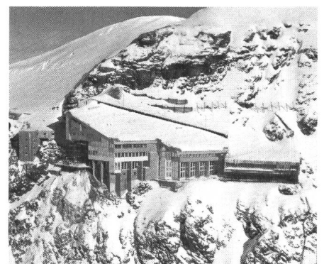
Bild 3 Berghaus Jungfrauojch

Wegen der tiefen Aussentemperaturen ist auf dem Jungfrauojch eine gute Wärmedämmung der Gebäude-