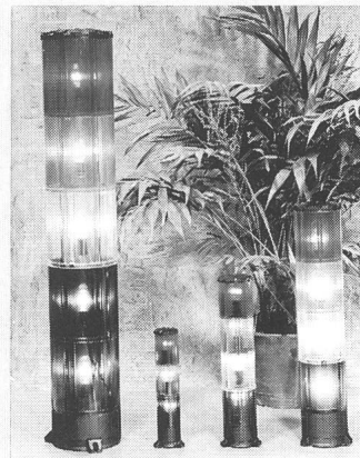
Optisches und akustisches Warnsystem

Das flexible, optische und akustische Warnsystem «Luxor» besteht in vier verschiedenen Grössen, mit diversen Befestigungsarten und eignet sich für jede