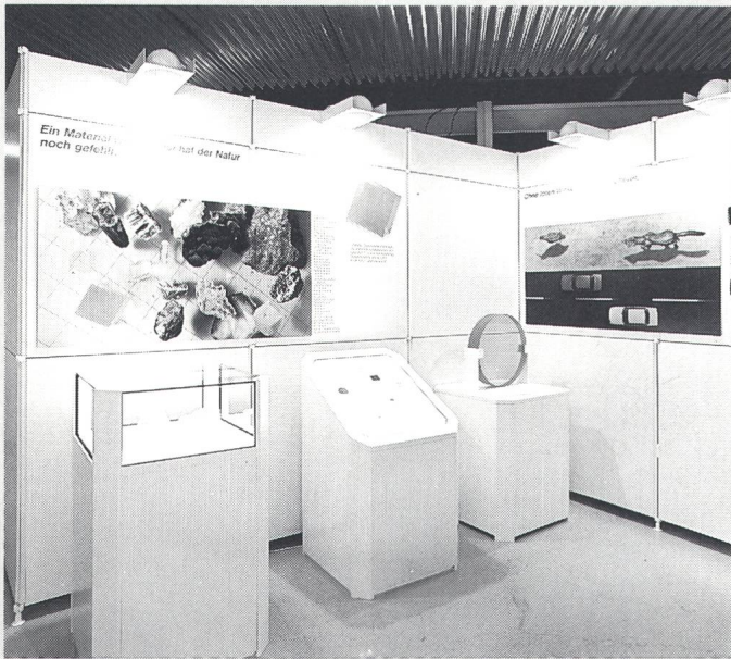
Querschnitt durch die gläserne Vielfalt