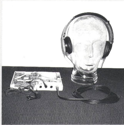
Prototyp «Digitaler Hörhilfe»

Die digitale Schaltungstechnik erlaubt es, eine adaptive, das heisst vom Signal selbst laufend abhängige, aktive «Lautverschärfung» einzubeziehen. Diese Signalverarbeitung muss aber genügend schnell erfolgen. Eine Verzögerung des Signals würde insbesondere die Schallortung des Hörgeschädigten beeinträchtigen. Im Prototyp der Ascom läuft das Sprachsignal