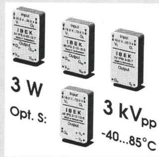
3 W/3 kVpp DC-DC-Konverter

Gehäuse mit einer Höhe von nur 10,5 mm mehr als hundert verschiedene Standardtypen. Die