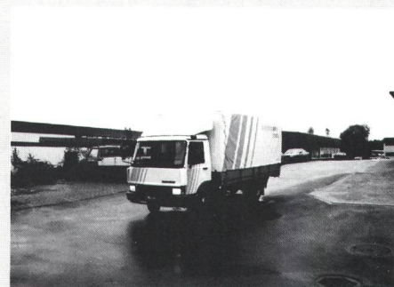
Anlieferungskonzept erlaubt optimalen Einsatz der Monteure

Mit einem auf die Kundenbedürfnisse zugeschnittenen Auslieferungskonzept und arbeitssparenden Bestellmöglichkeiten intensiviert der Lichttechnik-Spezialist Zumtobel AG, Rümlang, seinen Kundenservice. Seit Oktober letzten Jahres werden die Kunden, hauptsächlich Elektroinstallationsfirmen, wöchentlich mit 28 Fahrten bedient. Die Zustellungen erfolgen nach einem vorbestimmten Turnusplan, über den der Kunde informiert wird. Die Fahrzeuge von Zumtobel verfügen über Autotelefon, um die Lieferungen nach Wunsch zu avisieren oder kurzfristige Aufträge erledigen zu können. Schliesslich reagierte das Unternehmen auf die zunehmende Verbreitung der Telefax-Geräte mit einem fax-gerechten Bestellformular, welches erlaubt, den Bestellvorgang noch weiter zu verkürzen.