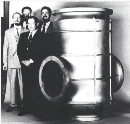
Weltgrösstes SF 6 -Schalter-Gehäuse

Für einen 600...800-kV-Schalter fertigt die Aluminium AG Menziken das weltgrösste SF 6 -Gehäuse. Mit dem 420 Kilogramm schweren Aluminium-SF 6 -Gussteil erschliesst die Giesserei neue Dimensionen. Zur Fertigung des 2 Meter hohen Gussteils werden 16 Tonnen Formsand verar-