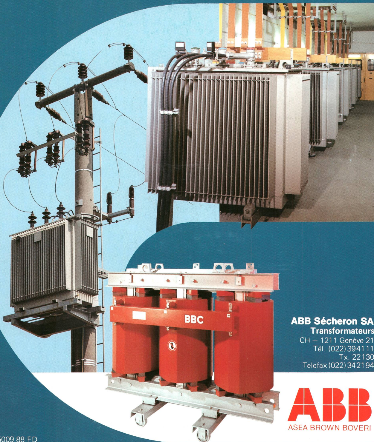
ABB Sécheron SA Transformateurs