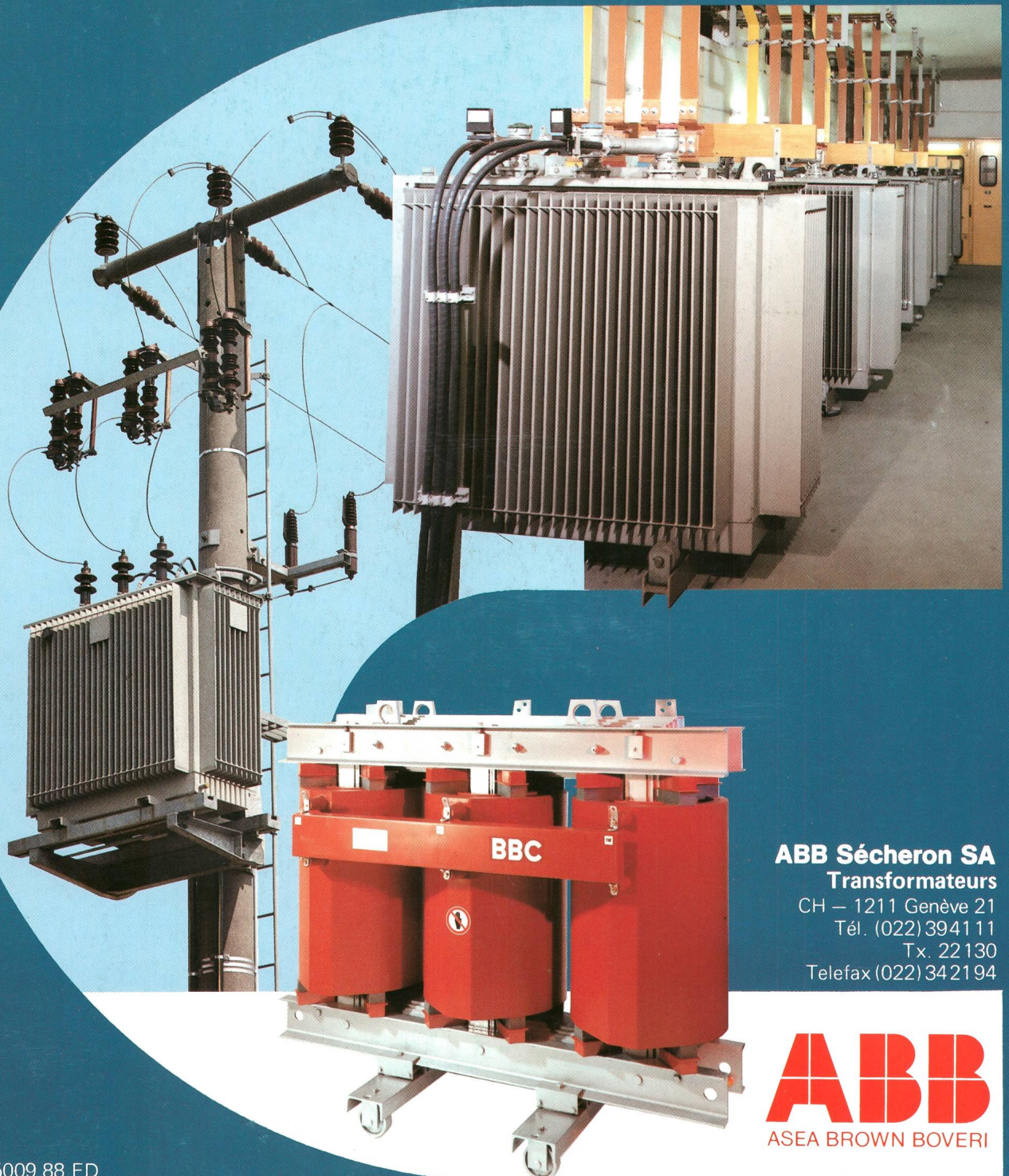
ABB Sécheron SA Transformateurs

CH - 1211 Genève 21 Tél. (022) 394111 Tx. 22130 Telefax (022) 342194