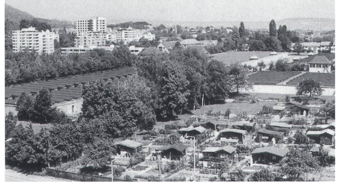
Figur 2 Fotomontage Sonnenkraftwerk Seewasserwerk Moos

In Parsonz – Premiere in dieser Grösse und Höhe im Alpenraum – könnten wesentliche Erkenntnisse über Bau und Betrieb eines alpinen Sonnenkraftwerkes, aber auch über dessen Akzeptanz und Verträglichkeit, gewonnen werden.