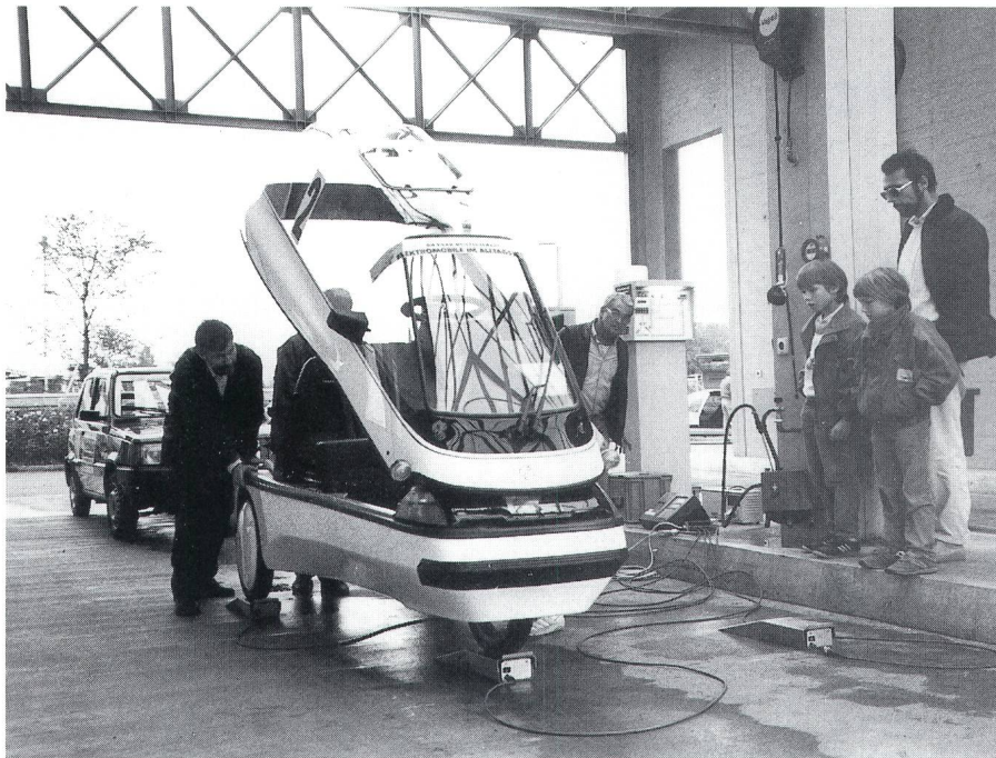
Ein Mini-EI und ein Larel bei der Technischen Prüfung.

häufig auftritt, in einer angemessenen Zeit, jedoch nicht das Erreichen von darüber hinausgehenden Spitzenleistungen. Neben der eigentlichen Wettfahrt selbst wurde aber eine ganze Reihe von Kriterien definiert, die zur Beurteilung der Alltagstauglichkeit herangezogen werden können und die