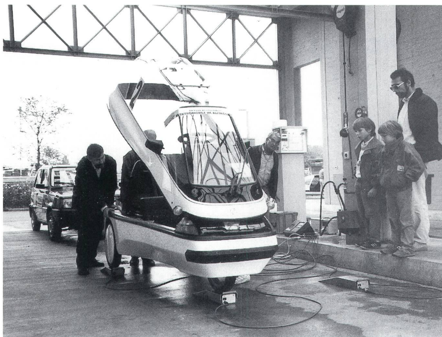
Ein Mini-El und ein Larell bei der Technischen Prüfung.

häufig auftritt, in einer angemessenen Zeit, jedoch nicht das Erreichen von darüber hinausgehenden Spitzenleistungen. Neben der eigentlichen Wettfahrt selbst wurde aber eine ganze Reihe von Kriterien definiert, die zur Beurteilung der Alltagstauglichkeit herangezogen werden können und die