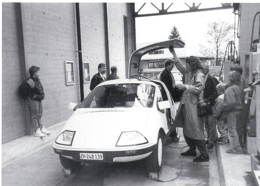
Der Pöhlmann EL wird bereits bei der Gewichtskontrolle bestaunt.

Formel-E-Veranstaltungen der letzten beiden Jahre Sonderpreise für das alltagstauglichste Elektrofahrzeug vergeben – wie übrigens auch bei der Tour de Sol. Es zeigte sich jedoch, dass diese Art der Bewertung, die an die eigentliche Wettfahrt angehängt wurde, nicht voll befriedigen konnte. Aus diesem Grund entschloss sich der ACS, in Zusammenarbeit mit der ASVER (Schweizerischer Verband für elektrische Strassenfahrzeuge) eine separate Prüfung und Bewertung der Alltagstauglichkeit durchzuführen – eben die erste «On-road-Meisterschaft für Elektromobile», «On-road» deshalb, weil sich diese Fahrt im Gegensatz zu den bekannten «Off-road-Veranstaltungen» auf ganz gewöhnlichen Strassen im normalen Verkehr abwickelte. Ziel war dabei die Bewältigung einer Strecke, wie sie im Alltag