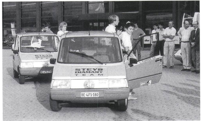
Das Steyr-Diamant-Team bei der Präsentation im Verkehrshaus.