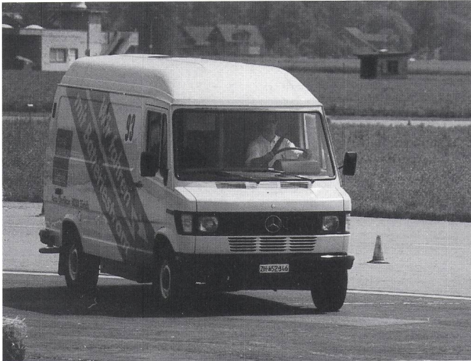
Ebenfalls ein bei den Grand-Prix-Formel-E-Veranstaltungen bestens bekannter Teilnehmer mit dem Elektro-Mercedes-Transporter der Accu Oerlikon.