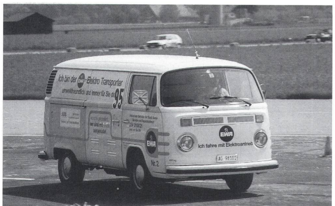
Der bereits seit Jahren im Alltagsinsatz stehende VW-Transporter des EWs Aarau konnte sich erneut ausgezeichnet platzieren.