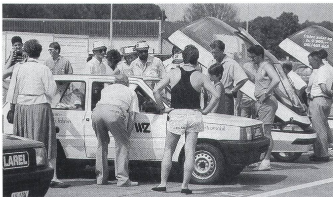
Verschiedene Elektromobile stehen für die Probefahrten bereit.