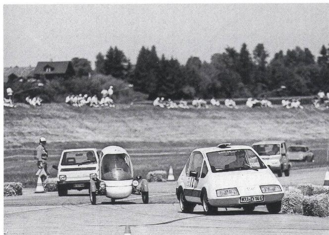
Verschiedene leichte Elektromobile der Kategorie Prototypen und Markenfahrzeuge im Duell.