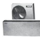
ANSON-„Split“ sind superleise

Für Büros, EDV, Sitzungs- und Schulungsräume etc. Leise, zugfrei, individuell regelbar. 220 V, 980 W. Rasch montiert. Ab Fr. 2800.-