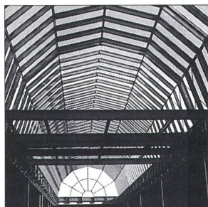
Hochbaukonstruktion (Unternehmensbereich Stahlbau)