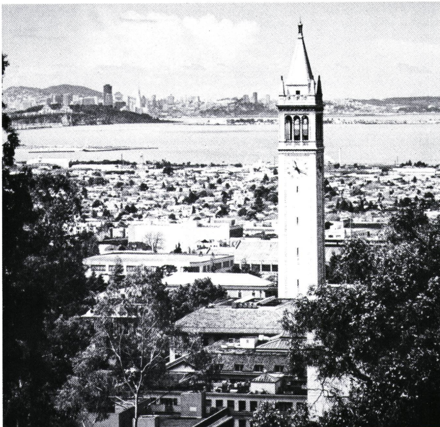
Figur 1 Blick auf die University of California. Im Hintergrund die Skyline von San Francisco

Das Alter des Lehrkörpers ist in den Staaten im Durchschnitt jünger als in der Schweiz, was sicher ein Zeichen für eine unterschiedliche Nachwuchsförderung ist. Im Gegensatz zur Schweiz ist in den Staaten eine akademische Berufung direkt nach der Dissertation keine Seltenheit. Der Vorteil dieser amerikanischen Methode zeigt sich in einer unkonventionelleren und dynamischeren Forschung sowie einer intensiveren Kommunikation zwischen Student und Lehrer. Andererseits fehlt dem amerikanischen Kollegen oft die (praktische) Erfahrung.