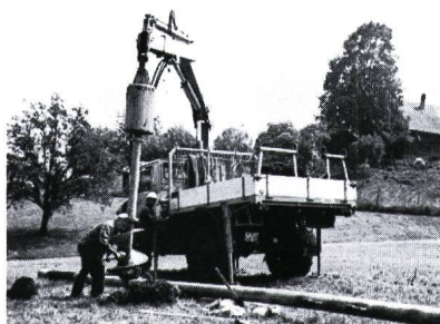
Erdbohrgerät im Einsatz