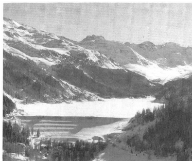
Stausee Marmorera des Elektrizitätswerkes der Stadt Zürich (EWZ)

Lac de retenue Marmorera des Forces Motrices de la ville de Zurich