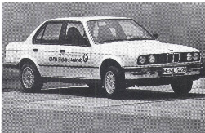
Figur 1 Der BMW 325 iX mit Elektroantrieb und NaS-Batterie

Die Hinterachsgeometrie ist ebenfalls identisch mit der des Serienfahrzeuges. Lediglich die Schräglenker wurden an ihren Anlenkpunkten und in ihrer Breite etwas geändert, um einen problemlosen Batterieeinbau von unten in das Fahrzeug zu ermöglichen. Diese Batterie mit den Massen 1420 mm × 485 mm × 360 mm ist in Längsrichtung in das Fahrzeug eingebaut. Sie durchdringt die Rücksitz-