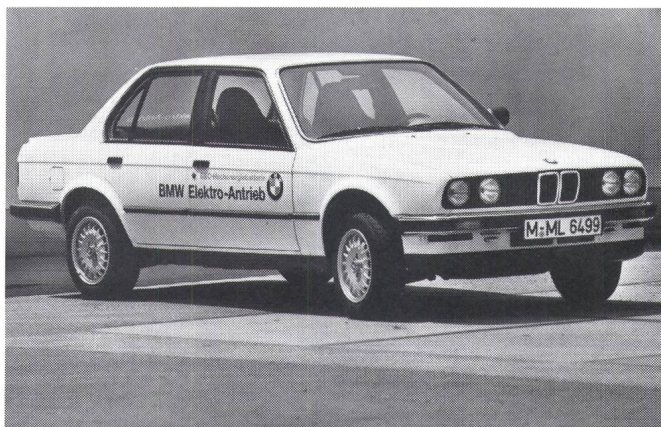
Figur 1 Der BMW 325 iX mit Elektroantrieb und NaS-Batterie

Die Hinterachsgeometrie ist ebenfalls identisch mit der des Serienfahrzeuges. Lediglich die Schräglenker wurden an ihren Anlenkpunkten und in ihrer Breite etwas geändert, um einen problemlosen Batterieeinbau von unten in das Fahrzeug zu ermöglichen. Diese Batterie mit den Massen 1420 mm × 485 mm × 360 mm ist in Längsrichtung in das Fahrzeug eingebaut. Sie durchdringt die Rücksitz-