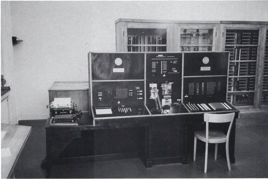
Figur 1. Blick auf die Bedienungskonsole der Z4 (1951)

In der Mitte Locher und Abtaster für die Lochstreifen, im Hintergrund Relais-Schränke mit Glasfront.