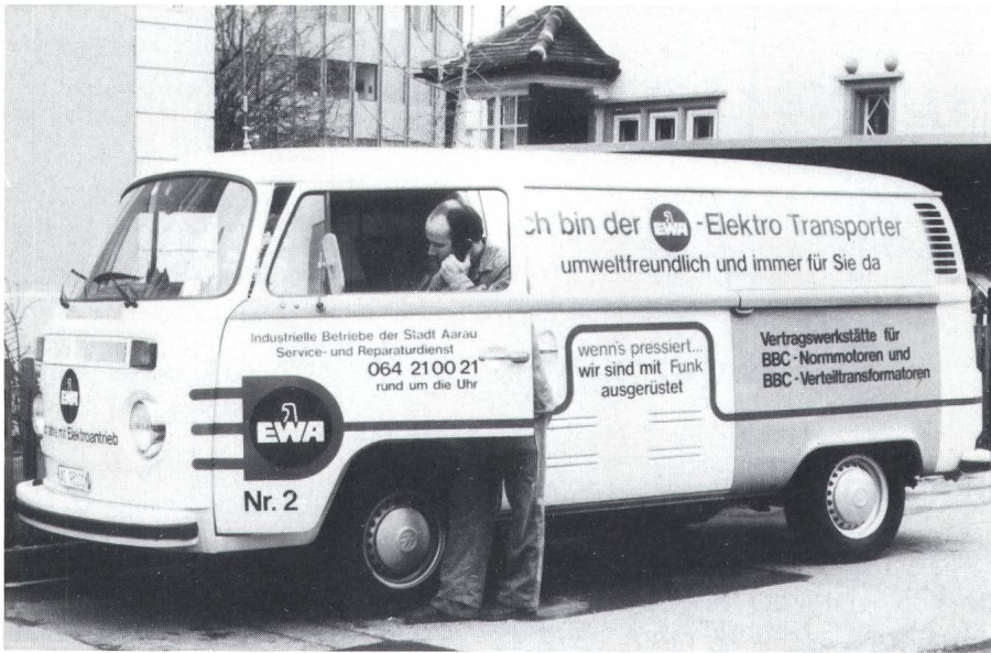
Fig. 2 Ein Elektrotransporter im täglichen Einsatz als Servicefahrzeug bei den Industriellen Betrieben der Stadt Aarau