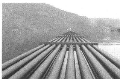
Die Kabelwerke Brugg realisierten zwischen Morcote und Brusino für AET und die SBB eine technisch anspruchsvolle Seekabelverlegung

Bulletin ASE/UCS 13/1985 Zürich, le 6 juillet 1985 76 e année, pages 741...804