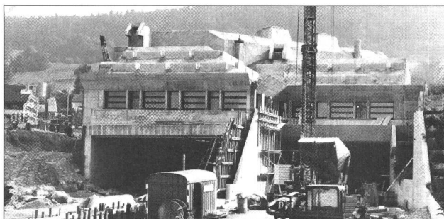
Tunnel-Rohbau Seite Weiningen mit später bepflanztem Lärmschutzwall

Dank der vorzüglichen Zusammenarbeit zwischen den Mitarbeitern der Elektrowatt Ingenieurunternehmung AG und den Brugger Fachleuten, konnte die Kabelanlage zum gesetzten Termin fertiggestellt werden.