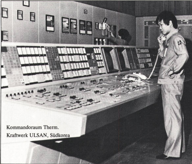
Kommandoraum Therm. Kraftwerk ULSAN, Südkorea

Beratung – Planung – Realisierung Montage – Inbetriebsetzung – Service für elektrische Anlagen der Energieerzeugung, -übertragung, -verteilung und -anwendung