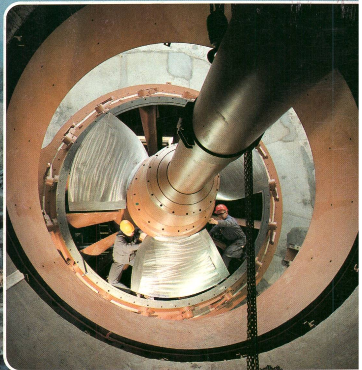
▲ Eine S-Turbine von Bell mit einem Laufrad-Durchmesser von 3200 mm deckt seit Frühjahr 1981 einen wesentlichen Teil des Energiebedarfes für die Papierfabrik Perlen/LU.

Einige Beispiele von S-Turbinen in aller Welt: