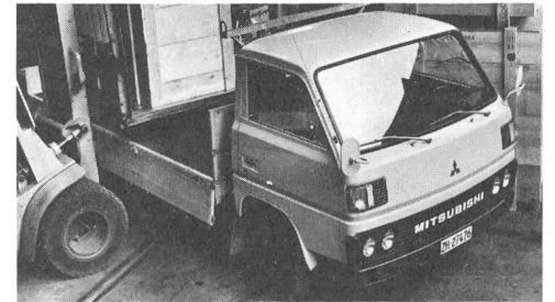
Canter. Mit 3,5 t und 5,5 t Gesamtgewicht, mit 2 Radständen, mit Benzin- oder Dieselmotor.

Mitsubishi Canter ab Fr. 22 990.- bis Fr. 28 290.-