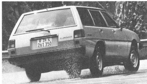
Mitsubishi Galant Kombi. Mit Benzin- oder Turbo-Dieselmotor.

Mitsubishi Galant Kombi ab Fr. 16 470.- bis Fr. 20 470.-