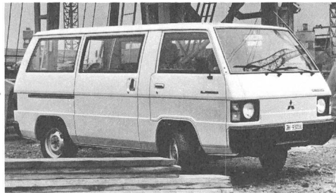
L 300. Als Chassis/Kabine, Brückenwagen, Kastenwagen, Kombi und Bus mit Benzinmotor.

Mitsubishi L300 ab Fr. 14 170.- bis Fr. 17 970.-