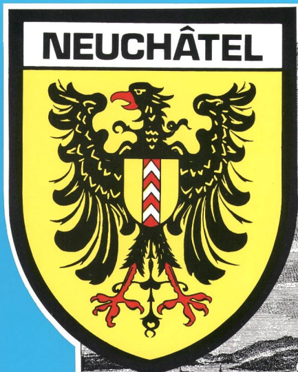
La ville de Neuchâtel, vers 1780

des Verbandes Schweizerischer Elektrizitätswerke de l'Union des Centrales Suisses d'Electricité