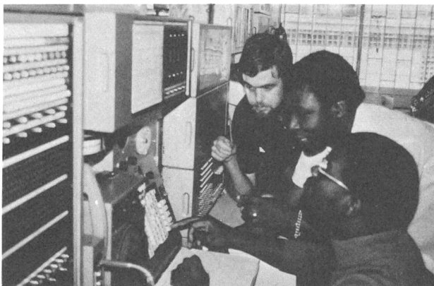
Fig. 1 Cours pour chefs de centres à Brazzaville (1978)

Dès 1964, des cours de base furent organisés à Renens, près de Lausanne, pour des spécialistes du téléphone et des liaisons par radio. Depuis cette période, de nombreux stagiaires se sont succédés, issus de pays francophones surtout, qui ont participé à des cours de base d'abord pour arriver plus tard à des stages de spécialisation et de gestion. Chaque année des cours groupant douze à vingt élèves ont été organisés. Des boursiers isolés ont aussi été accueillis, la plupart à la charge du Programme des Nations Unies pour le Développement (PNUD).