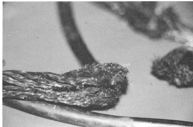
Fig. 3 Zustand einer defekten Erdungsgarnitur

abgerieben, und die Korrosion kann wieder angreifen. Da die Oberfläche der feindräftigen Litzen im Verhältnis zum Querschnitt sehr gross ist, erfolgt bald ein Bruch der einzelnen Teilleiter.