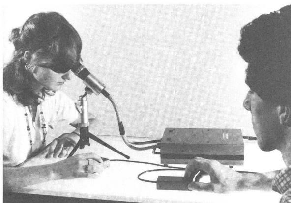
Fig. 2 Papillomètre, instrument utilisé en ophtalmologie

La tâche fondamentale d'un ingénieur universitaire de ce type est la conception de produits spécifiques de la microtechnique. Comme tous les ingénieurs des écoles polytechniques, il doit avoir une bonne base théorique en mathématiques et en physique. De plus, il doit être à l'aise dans les questions technologiques. Il faut donc, dès le début de ses études, l'habituer au travail de conception et le familiariser avec les procédés de fabrication.