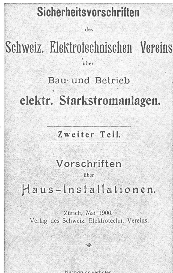
Fig. 2 Die noch vor dem Elektrizitätsgesetz erlassenen ersten Hausinstallationsvorschriften des SEV

Anders verhält es sich, wenn der Gesetzgeber direkt auf konkrete (Verbands-) Normen verweist; dies erscheint ganz besonders dann unzulässig, wenn sich der direkte Verweis auf undatierte Verbandsnormen bezieht, also «dynamisch» ist. Bei der dynamischen Verweisung besteht überhaupt keine Gewähr mehr dafür, dass in Zukunft der private Normgeber nicht gegen das dem Gesetz zugrundeliegende Gedankengut «normiert» und damit jene Normen ändert, die seinerzeit notwendiges tat-